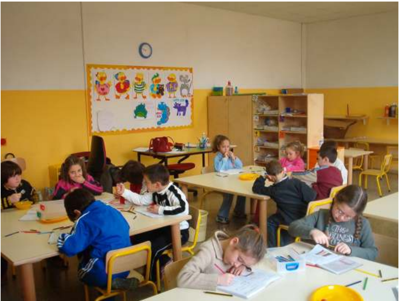
classe 2° scuola primaria di Nozzano circolo didattico n. 7 Lucca

Nelle classi spesso gli insegnanti attribuiscono la responsabilità agli studenti dei successi o dei fallimenti nell'apprendimento, senza per la verità aver costruito un ambiente effettivamente democratico. La democrazia si impara in una scuola in cui gli alunni possono intervenire nelle scelte, che riguardano gli apprendimenti e la convivenza scolastica, e sono liberi di farlo perché dotati anche di autonomia, consapevolezza e potere (empowerment).