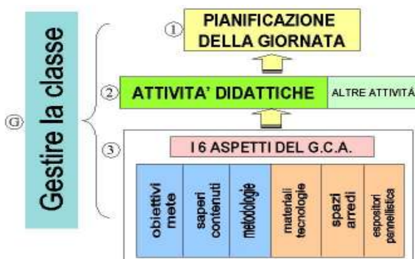
fig. n. 1