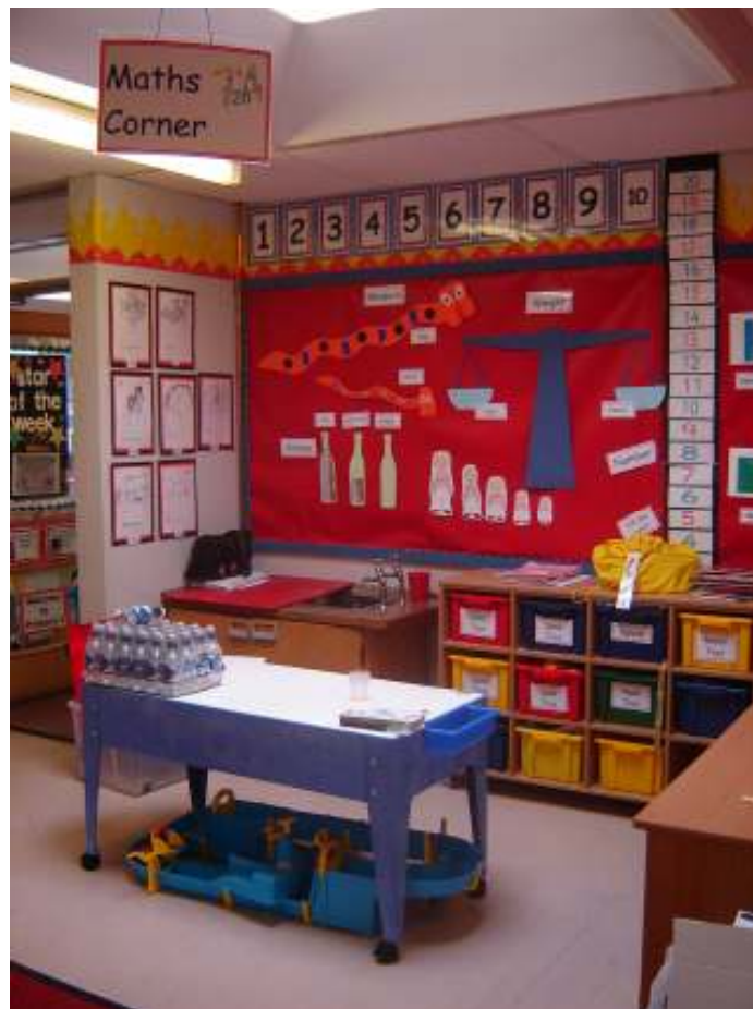
Scuola scozzese visitata da insegnanti del progetto Senza Zaino